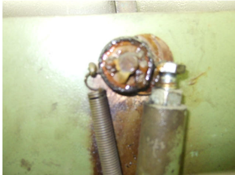
Vue de dessous avec les vis de réglage lames